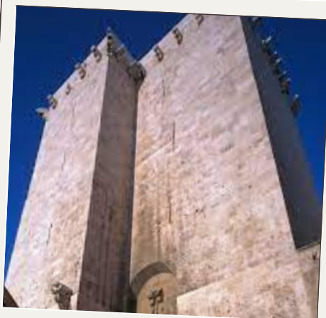
LE VECCHIE MURA