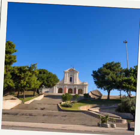
IL COLLE DI BONARIA