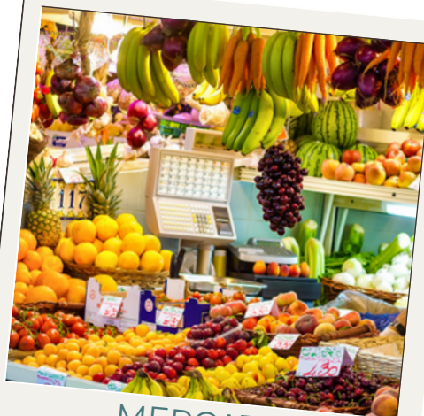
MERCATO DI SAN BENEDETTO